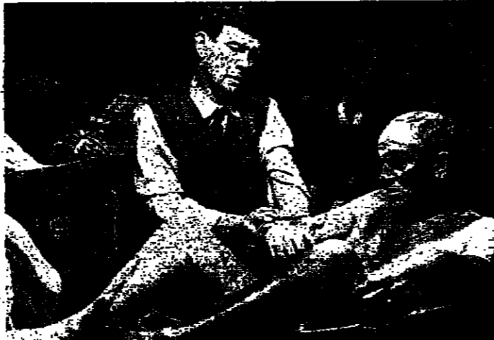
البيبي فيني وتوم كورتني في (The Dresser)

رسم تسع مرات في صفه، بحيث بلغ حوله يتشور الضلم والأحداث وهو يجد نفسه ينهار فجأة تحت ضغط ابقاء شركته على الطريق.